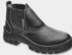
50B19A CP ANT