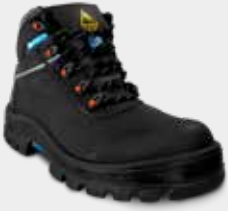
75BPR29 CLI MP EC PAP