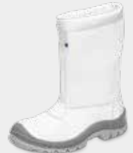
70C32 A FRI CP