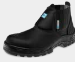
70B19 C PAP