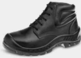
50B22 A CP