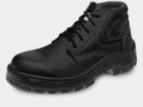
70B22 EC CP