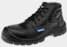
50B22 CPAP CP