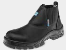
50B19 C PAP