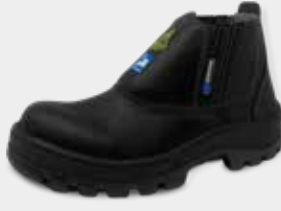
70B19 EC CP