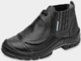
60B19A PA MEX CP