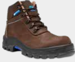
75BPR29 MSNP CPAP PAD